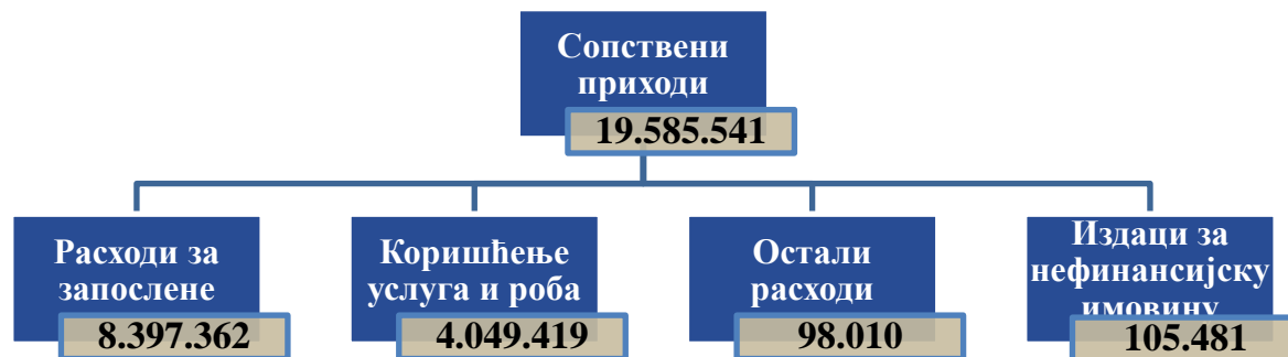
Графикон број 2: Структура расподеле сопствених прихода

↓ Финансирање материјалних трошкова установа из области ученичког и студентског стандарда, које Министарство просвете, науке и технолошког развоја врши на основу испостављених фактура установа.